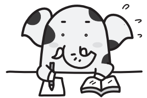
新座市イメージキャラクター ゾウキリン

社会福祉協議会では、学費等の捻出が困難な低所得世帯の学生に対し、教育支援資金貸付(無利子)を実施しています。