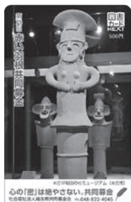
本庄早稲田の社 ミュージアム(本庄市)