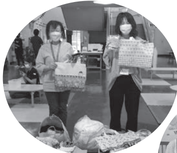
けやきの森保育園

音羽の森新座保育園 山びこ保育園 まこと保育園 新座市立第一保育園 けやきの森保育園 栗原第二 妙音沢もみじ保育園 新座市児童センター 殿山亀寿苑 多機能ホームまどか さわやか学舎 けやきの家 こぶしの森