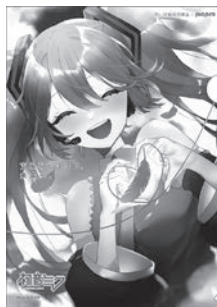
Art by nio © CFM