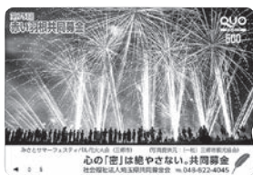
みさとサマーフェスティバル 花火大会(三郷市)