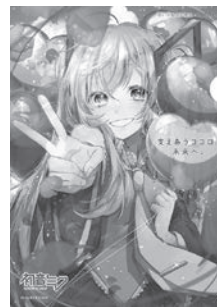
Art by あずき © CFM