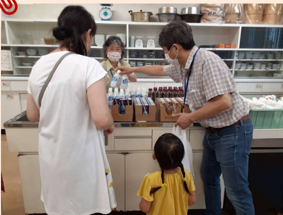
フードパントリーやこども食堂活動に