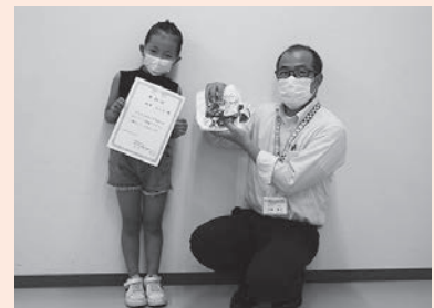
作成した物品を届けてくれた小学生

新型コロナウイルス感染症への対応で大変な状況の中、市内の福祉施設を応援する目的で施設が必要とする雑巾やマスク、牛乳パックで作った椅子などの施設から要望のあった物品を市民の方々に作成いただき、市内福祉施設にお届けするボランティア活動を実施しました。夏休み期間中には、彩の国ボランティア体験プログラムの一環として小・中学生の参加も多く、自分で作成した物品の寄付がたくさんありました。