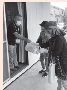
会食ふれあい事業「特例の取組」を実施する社協野寺支部の様子