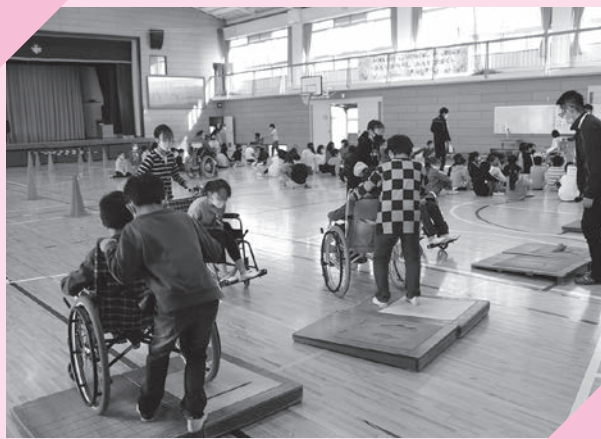
車椅子体験の様子

実際に車椅子を操作したり、目隠しをして歩いたりするなどの体験と障がいのある方のお話を聞くことを通じて、児童・生徒に福祉について興味を持ってもらい、障がいの有無が特別な違いではないことなどを伝えています。