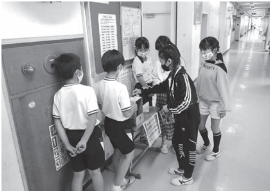
野火止小学校での学校募金の様子