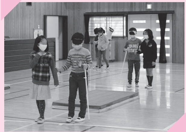
アイマスク体験の様子