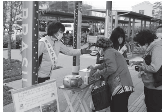
市役所前での街頭募金の様子

令和2年10月から令和3年3月までの間に実施される赤い羽根共同募金及び地域歳末たすけあい募金活動による皆様からの寄付金は、埼玉県共同募金会で集計され、新座市内及び埼玉県内の福祉事業に活用されます。