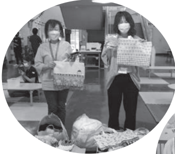
けやきの森保育園